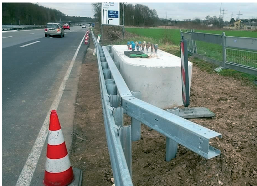
Bild 2: Beispielhafter Einsatz von ESP BOS vor Anprallsockel nach RiZ VZB 4

Im Stahlschutzplanken-Info 1/2014 wurde berichtet, dass bei beengten Verhältnissen vor flächenhaften Hindernissen der Gefährdungsstufe 3 nach RPS 2009, wie z.B. Brückenpfeilern, Widerlagern oder Stützmauern, das System ESP BOS (N2-W3-B) einsetzbar und als Modifikation zugelassen ist. Eine weitere Einsatzmöglichkeit besteht bei Anprallsockeln von Verkehrszeichenträgern bzw. Schilderbrücken, wenn diese wie nach RiZ VZB 4 auf Anprall bemessen bzw. nicht einsturzgefährdet sind und gemäß RPS eine Absicherung in der Aufhaltstufe N2 genügt, also für den Fall v_{zul} \leq 100 km/h. Ein ausgeführtes Beispiel ist in Bild 2 dargestellt.