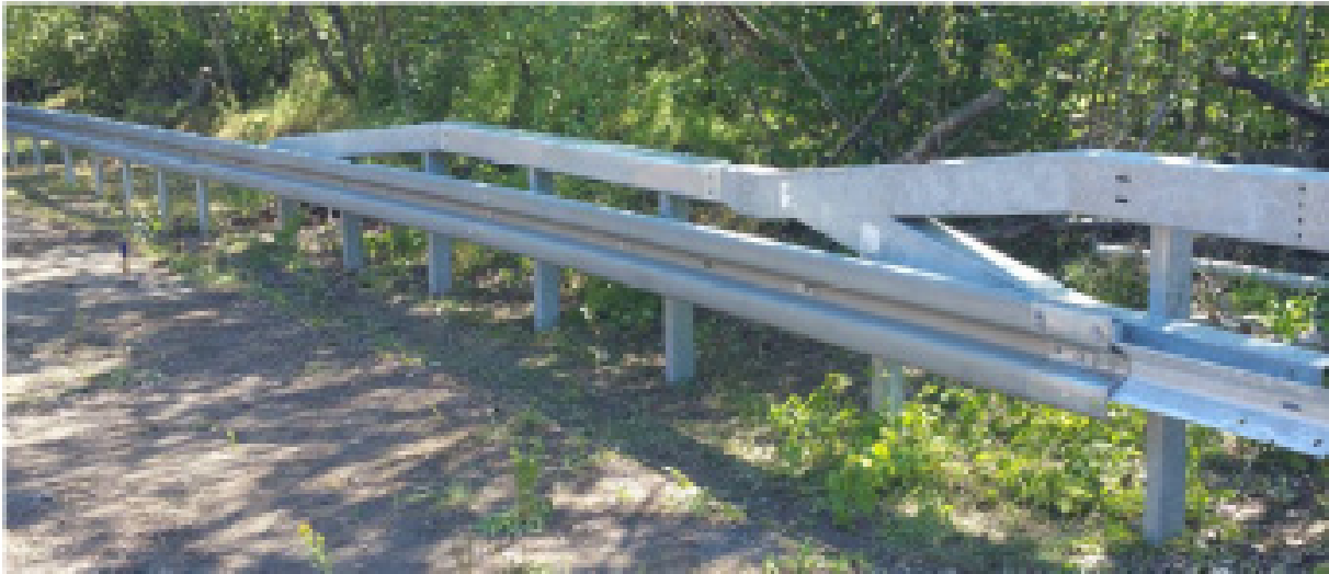
Bild 1: FLEXTRA Eco-Safe - SUPER-RAIL (H1-W4-B; TÜL-Nr. ÜK-4078 / 4079)